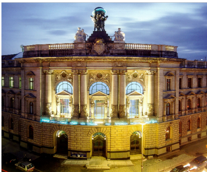
Unser Tagungsort: Blick auf den abgerundeten Eckbau des Museums bei Dunkelheit. Das Haus wird nachts von innen blau erleuchtet.

15.00 - 16.00 Uhr Mitgliederversammlung IADM e. V.